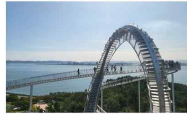
해상 스카이워크와 스페이스워크 중 원하는 코스 1가지를 골라 개별 관광으로 진행